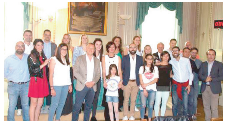
Il gruppo dell'Lpm Bam A2 ricevuto in Comune