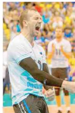
L'estone Kollo