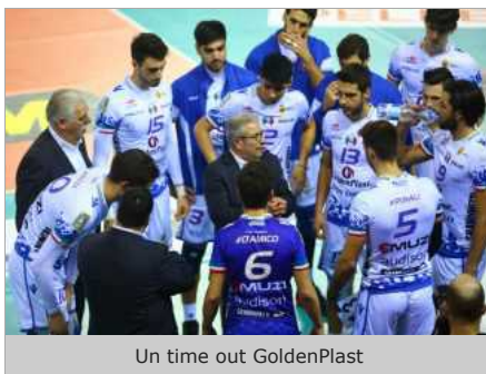
Un time out GoldenPlast

La nona giornata di ritorno del Girone Bianco riserva un banco di prova molto impegnativo per la GoldenPlast Potenza Picena, impegnata domenica alle 18 in casa contro la capolista Synergy Arapi F.lli Mondovì, che all'andata in Piemonte sconfisse i biancazzurri con il massimo scarto. In campo due