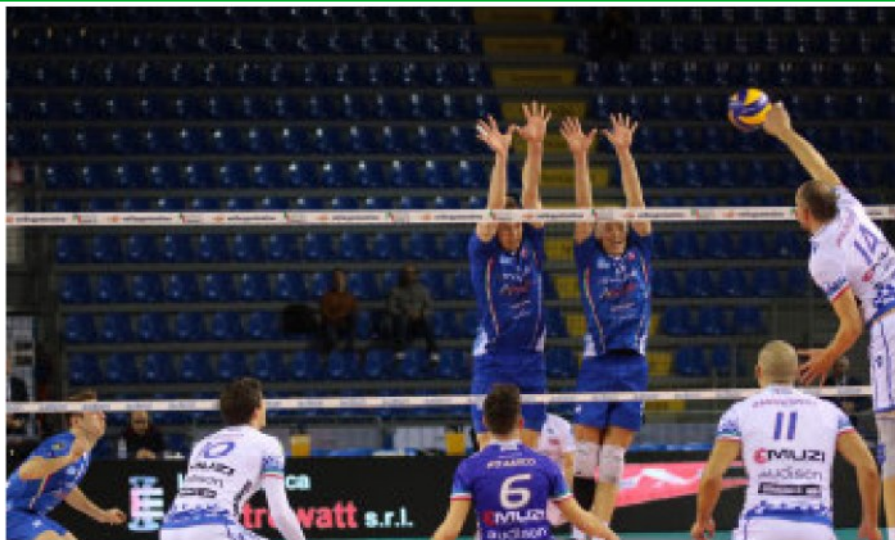
Un'azione del match